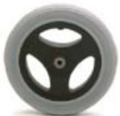
RUEDA TRASERA MACIZA 12" (Ø 300 mm.)