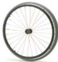
RUEDA DE RADIOS MACIZA 24" (Ø 600 mm.) Ref. N30