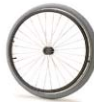
RUEDA DE RADIOS NEUMÁTICA 20" (Ø 500 mm.) Ref. N46