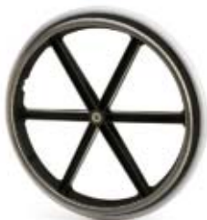
RUEDA SPORT MACIZA 24" (Ø 600 mm.) Ref. N32.1