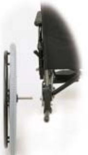
EJE DE DESMONTAJE RÁPIDO Ref. N35